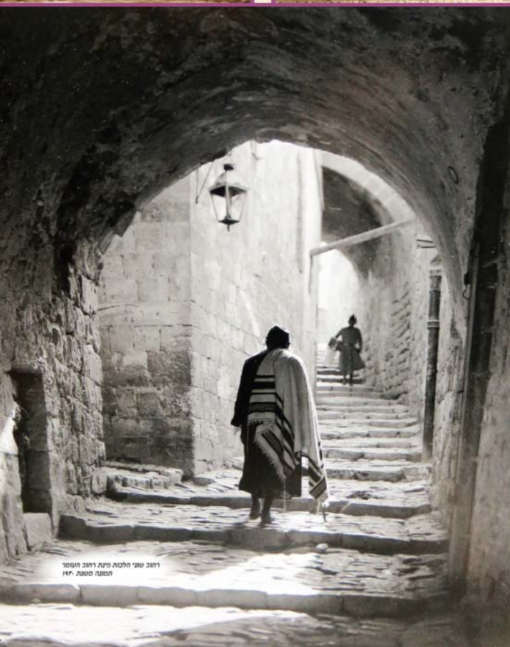
רחוב שוני הלכות פינת רחוב העומר תמונה משנת 1910

רחוב שוני הלכות طريق سوني هالحوت SHONEI HALACHOT RD.