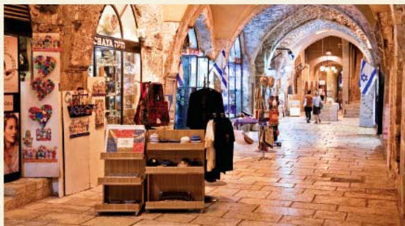
הקארדו הביזנטי ברובע היהודי