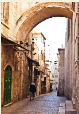
קשת 'אקה הומו'

23) פילטוס רחץ את ידיו ואמר: "נקי אני מדם הצדיק הזה" והעם ענה כי הם מקבלים אחריות על ההחלטה: "דמו עלינו ועל בנינו". פילטוס צוה להלקות את ישוע (מרקוס, מתי ויוחנן). אנשי הצבא הרומיים התעללו בישוע, הלכו אותו, הלבשוהו בבגדי ארגמן וגיחכו כשהם מכנים אותו בתואר "מלך היהודים". בנוסף, עיטרו את ראשו בכתר קוצים, ברכו אותו "שלום לך מלך היהודים", ידקו עליו והשתחוו לפניו כאקט של גיחוך (מרקוס ט"ז, מתי כ"ז). פילטוס הוציאו בלבשו המלכותי הנלעע אל ההמון וקרא: "הנה האיש" (יוחנן, י"ט, 5). במסורת הנוצרית קוראים לקשת ברחוב ויה דולורזה מול מנזר 'האחיות ציון' בשם זה ("אקה הומו" - Ecce Homo). בעת בניית המנזר התגלתה קשת הצמודה לקשת הנוכחית מצפון ונמוכה ממנה. למעשה מדובר בקשת ניצחון, בדומה לקשת הקיימת בשער שכם מהתקופה הרומית שאת שתיהן הקים כנראה אדריאנוס לאחר דיכוי מרד בר-כוכבא, כ-100 שנה לאחר צליבת ישוע.