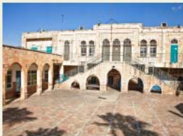
תנ"ך בית הספר אלעמריה

מקום המשפט התקיים ב"פרטוריום" (מפקדת הנציב) שהיה באחד מארמונותיו של המלך הורדוס. כיום מזוהה המקום כבית ה"ס אלעמריה הכניו על חלק ממצודת האנטוניה שבנה הורדוס. פונטיס פילטוס, שמקום מושב הקבע שלו היה בקיסריה, הגיע לירושלים כדי לפקח על ההתקלות בהר הבית בחג הפסח ומיקם ככל הנראה את המפקדה שלו במצודת האנטוניה. 4 גרסאות ברית החדשה מעלות את התמונה הבאה: ישוע הובא לפניו באשמה של מרידה במלכות ומשיחיות. פילטוס פנה לישוע בשאלה האם הוא "מלך היהודים" וישוע לא הכחיש וענה "אתה אמרת" (מרקוס ט"ז, יוחנן כ"ג). ישוע החל לדבר על "מלכות שמים" ופילטוס שלא מצא בסיס לאשמה ניסה להעביר את הדיון לפתחו של מושל הגליל, הורדוס אנטיפס כיוון שמוצאו של ישוע היה מן הגליל.